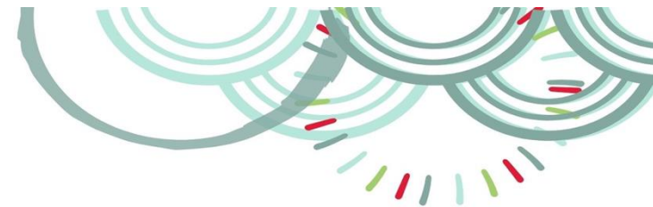
Tableau synthétique des principaux droits syndicaux dans la FPT